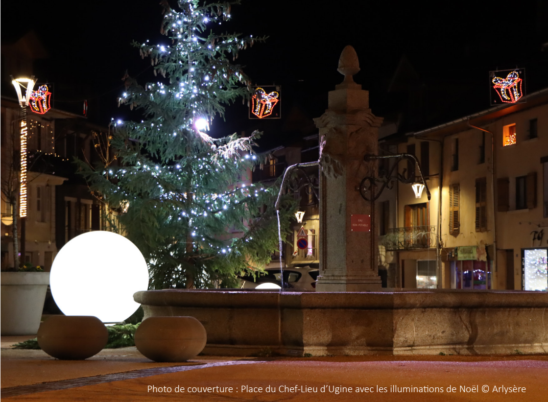
Photo de couverture : Place du Chef-Lieu d'Ugine avec les illuminations de Noël