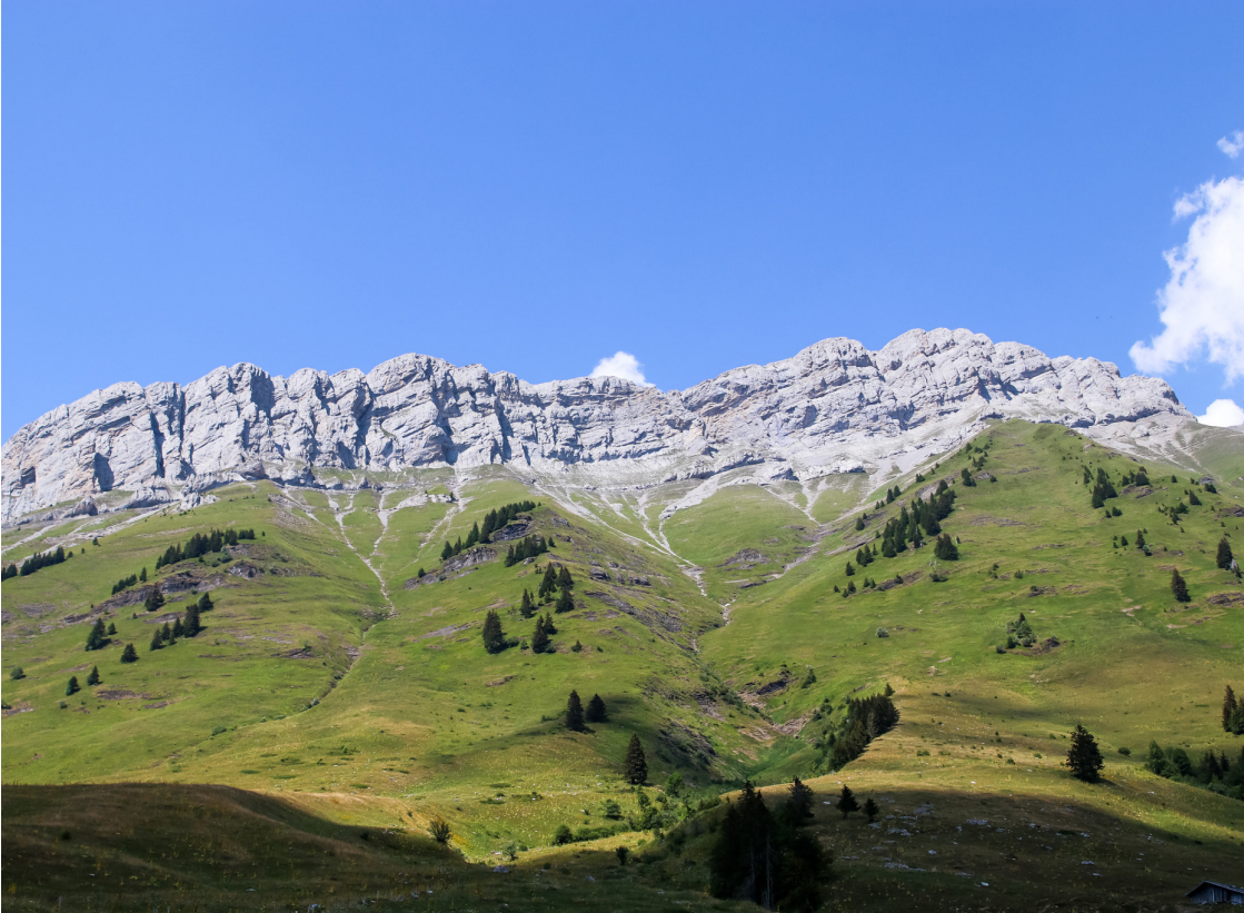
Photo de couverture : Col des Aravis- La Giettaz en Aravis